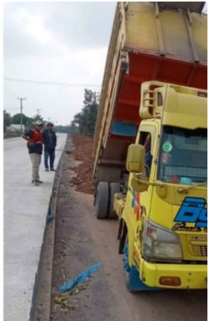
Mobil Pengangkut Tanah Galian C